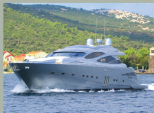
VIelfALT & AUSWAHL ALLE BOOTSKATEGORIEN MIT & OHNE SKIPPER