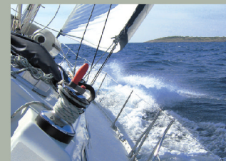
BOOTSFÜHRERSCHEIN FÜR MOTORBOOT UND SEGELBOOT AB 400 EUR