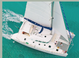
WEITUMSEGELUNGSTOUR ANHEUERN FÜR 1-2 WOCHEN AUF UNSEREM KATAMARAN