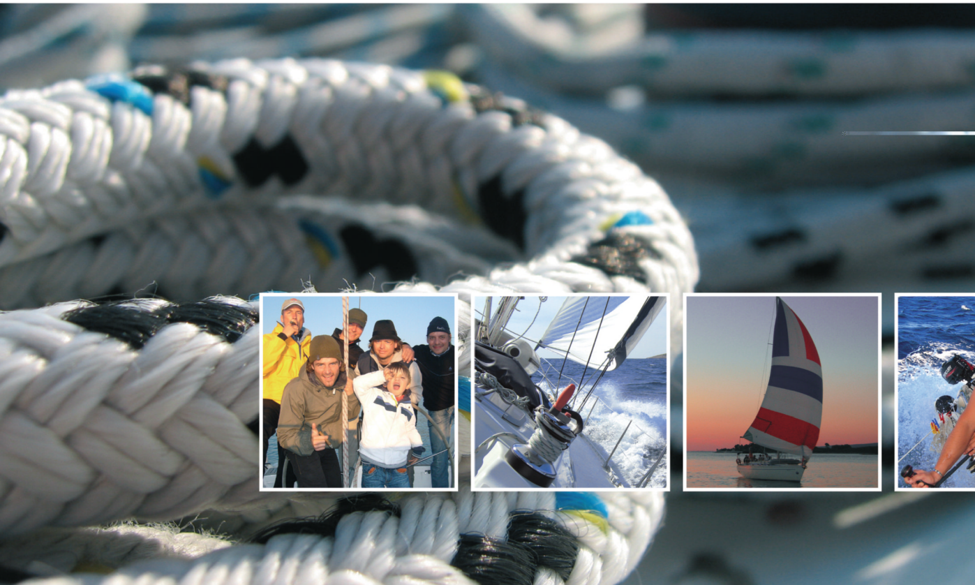
Segelboote, Motorboote, Führerscheine, Funkscheine, Skippertrainings, Bareboat, alle Reviere weltweit, Auswahl aus 2.500 Yachten, seit 20 Jahren